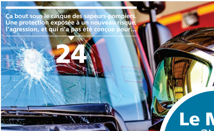
24 Ça bout sous le casque des sapeurs-pompiers. Une protection exposée à un nouveau risque, l'agression, et qui n'a pas été conçue pour...