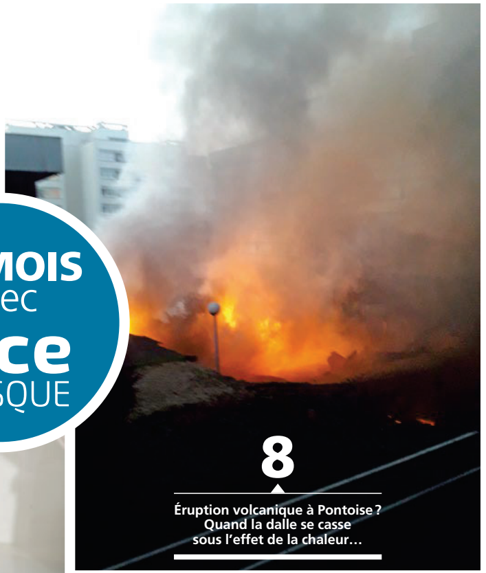
8 Éruption volcanique à Pontoise ? Quand la dalle se casse sous l'effet de la chaleur...