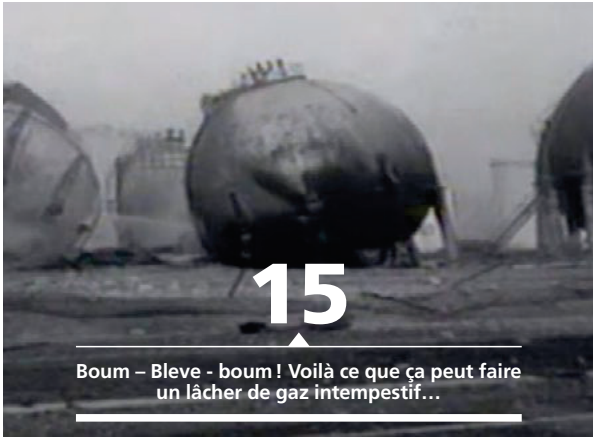
15 Boum – Bleve - boum ! Voilà ce que ça peut faire un lâcher de gaz intempestif...