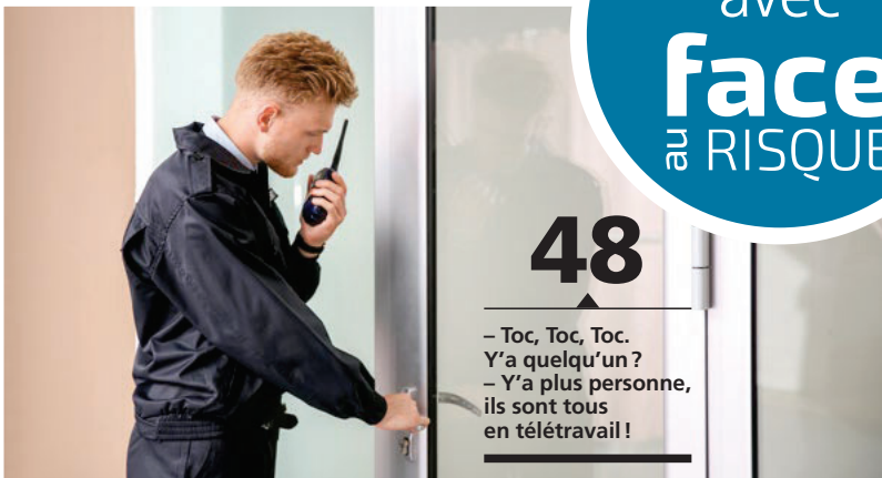
48 – Toc, Toc, Toc. Y'a quelqu'un ? – Y'a plus personne, ils sont tous en télétravail !