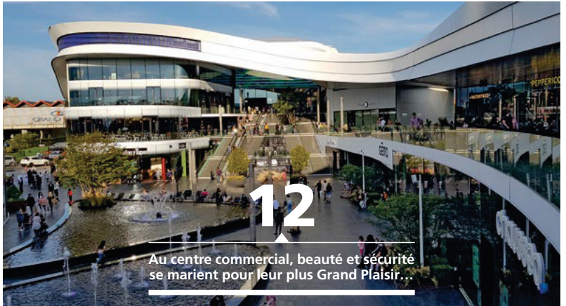
12 Au centre commercial, beauté et sécurité se marient pour leur plus Grand Plaisir...