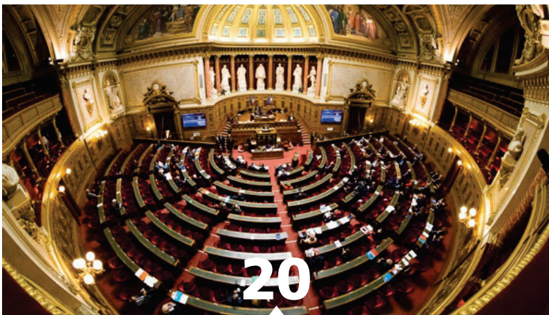
20 Dépêchez-vous les parlementaires, la loi Asap n'attend pas !